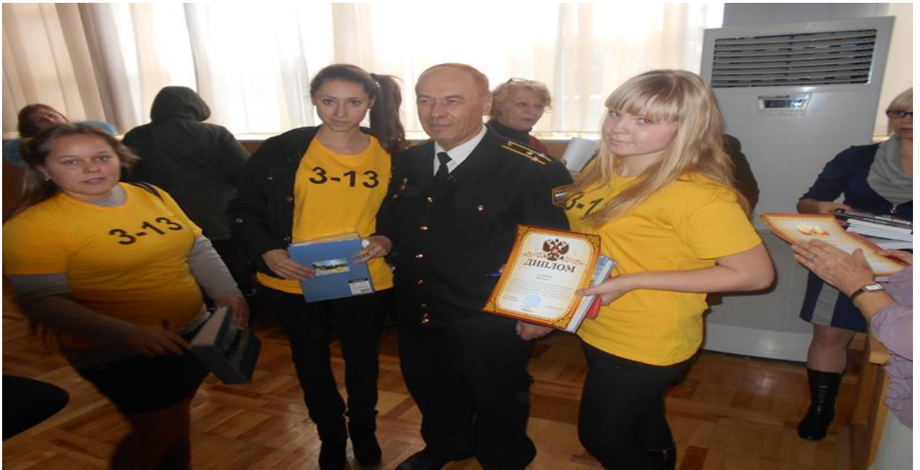
Цикл встреч допризывной молодежи с ветеранами ВОВ и участниками боевых действий в локальных войнах (Афганистан)