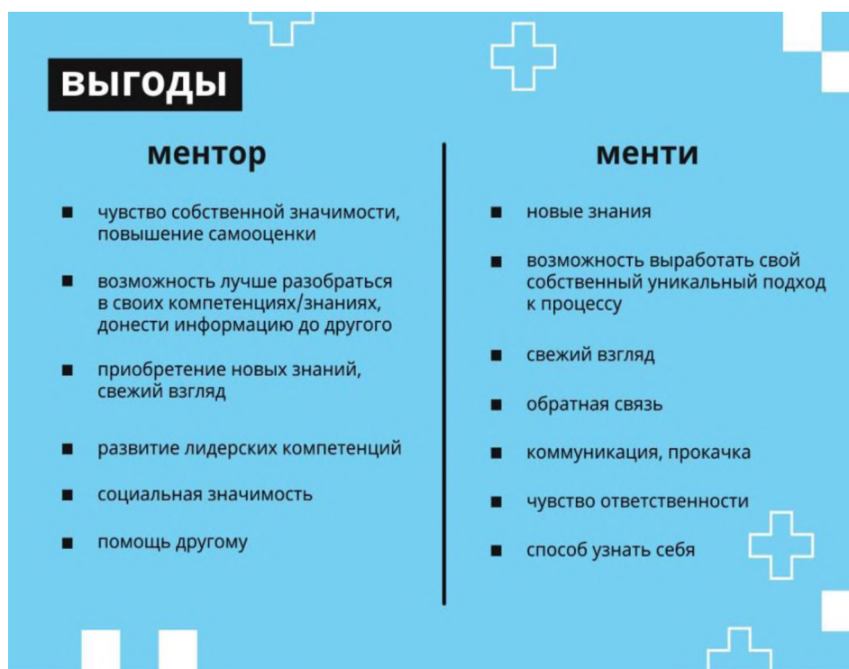
Рис. 3 – возможные мотивы участников менторской программы

Обсудите с менти, каких целей он хотел бы достичь за время программы (это могут быть как карьерные цели, так и развитие на текущей должности). Помогите выявить те целевые должности или сферы деятельности, где, на ваш взгляд, менти смог бы максимально реализовать свой потенциал.