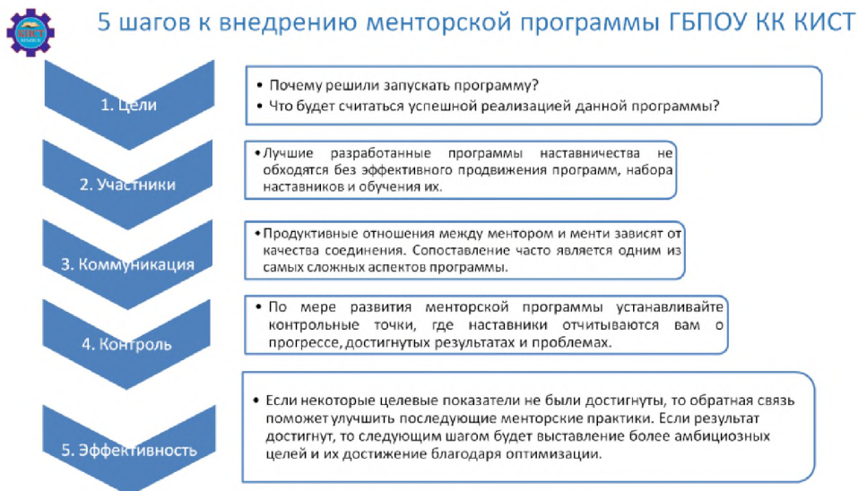
Рис 2 – система менторской программы ГБПОУ КК КИСТ